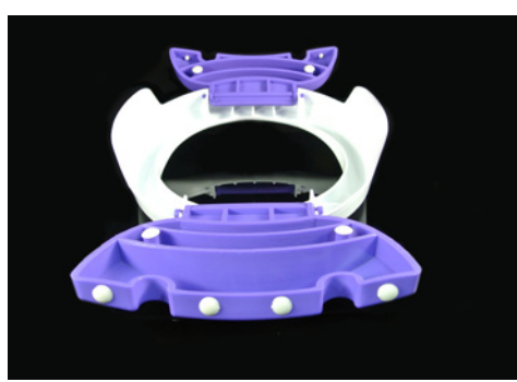
Soportes antideslizantes Cuenta con soportes antideslizantes para mayor estabilidad y seguridad.