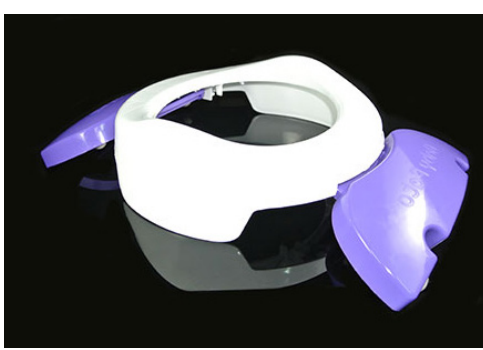
Reductor de sanitario Al abrir sus dos extensiones funciona como reductor de sanitario en el hogar, o en baños publicos aislando al menor de bacterias presentes en el WC