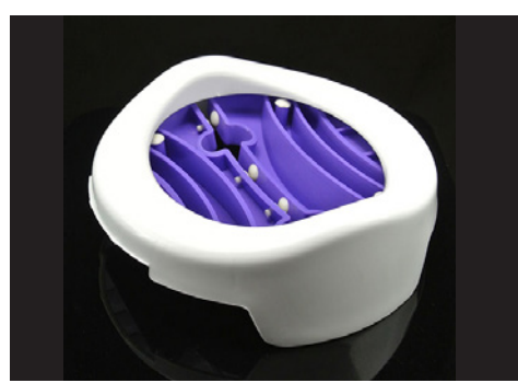
Portátil Práctico sanitario portatil, liviano e higiénico se puede llevar a todas partes